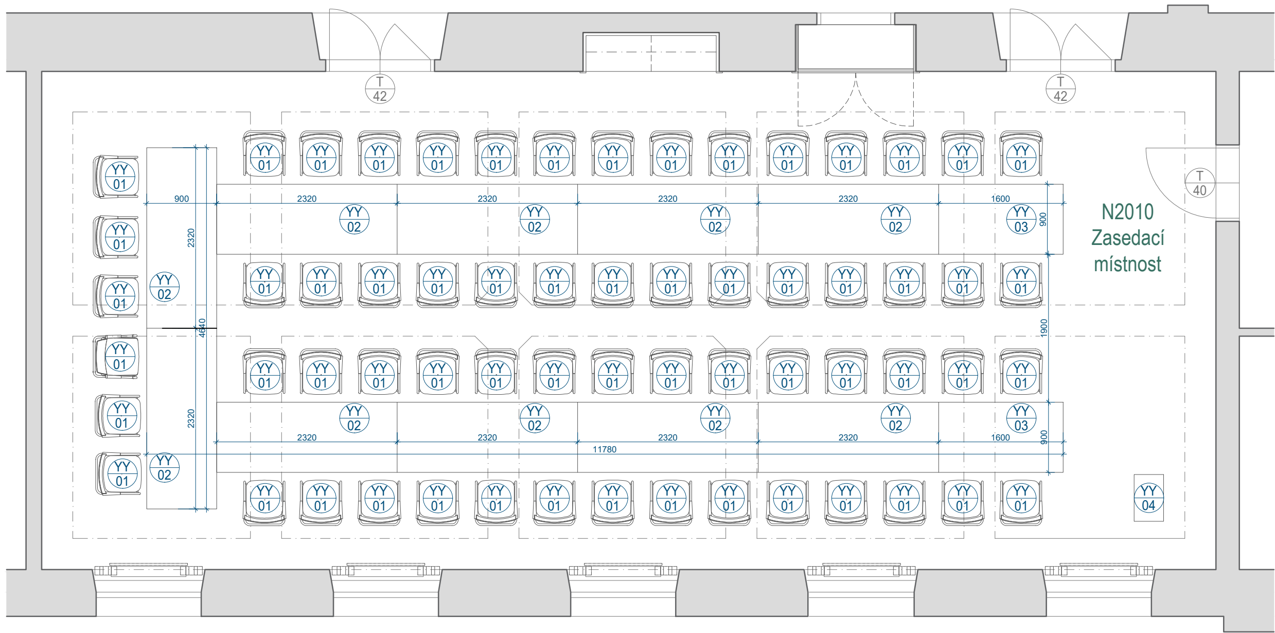
SCHÉMA OBJEKTU 2.NP